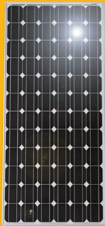
Monokristallines Modul (Detailansicht)